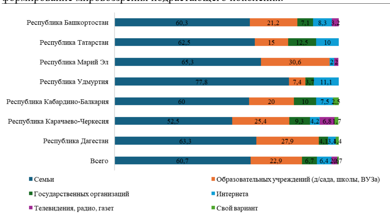
Рисунок 2 – распределение ответов на вопрос «Чья роль более значима в патриотическом воспитании?» по регионам.

Отрадно констатировать, что подрастающему поколению зуммеров в семье удалось привить позитивное отношение к пониманию важности как роли семьи, так и самих ценностей. О важности роли семьи свидетельствует еще одна диаграмма, в которой также зафиксированы значительное количество ответов, отдающих предпочтение семье и семейным отношениям. На вопрос «Чья роль более значима в патриотическом воспитании?», респонденты снова на первое место поставили семью, роль которой оценивается совершенно однозначно. Другие ориентиры тоже важны, но они значительно отстают в своем влиянии на формирование мировоззрения подрастающего поколения.