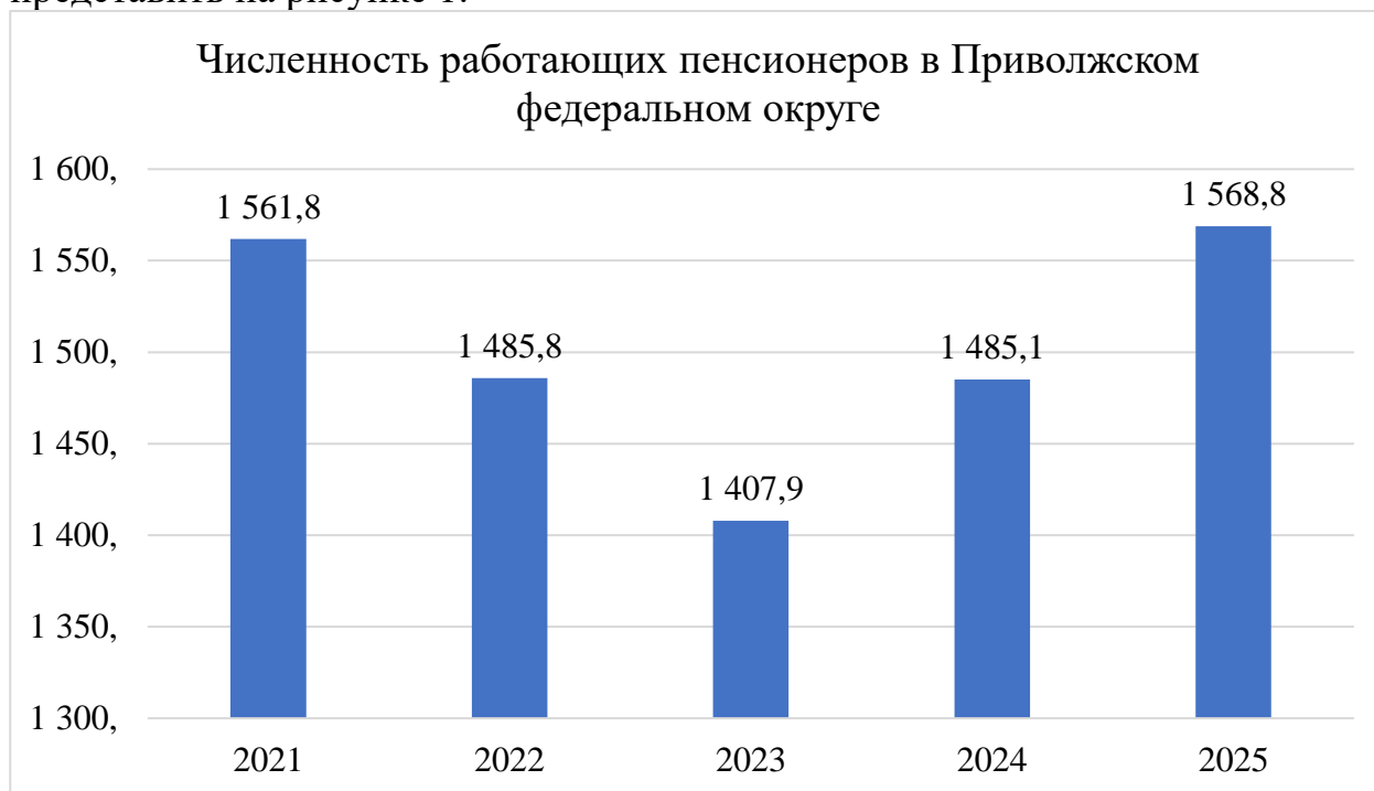
Рисунок 1 – Численность работающих пенсионеров в Приволжском федеральном округе (тысяч человек) [9]

Несмотря на появившиеся у лиц старше трудоспособного возраста возможности культурно отдыхать на заслуженном отдыхе, часть пенсионеров продолжает трудиться во благо страны и ее регионов. Наглядно численность работающих пенсионеров в Приволжском федеральном округе можно представить на рисунке 1.