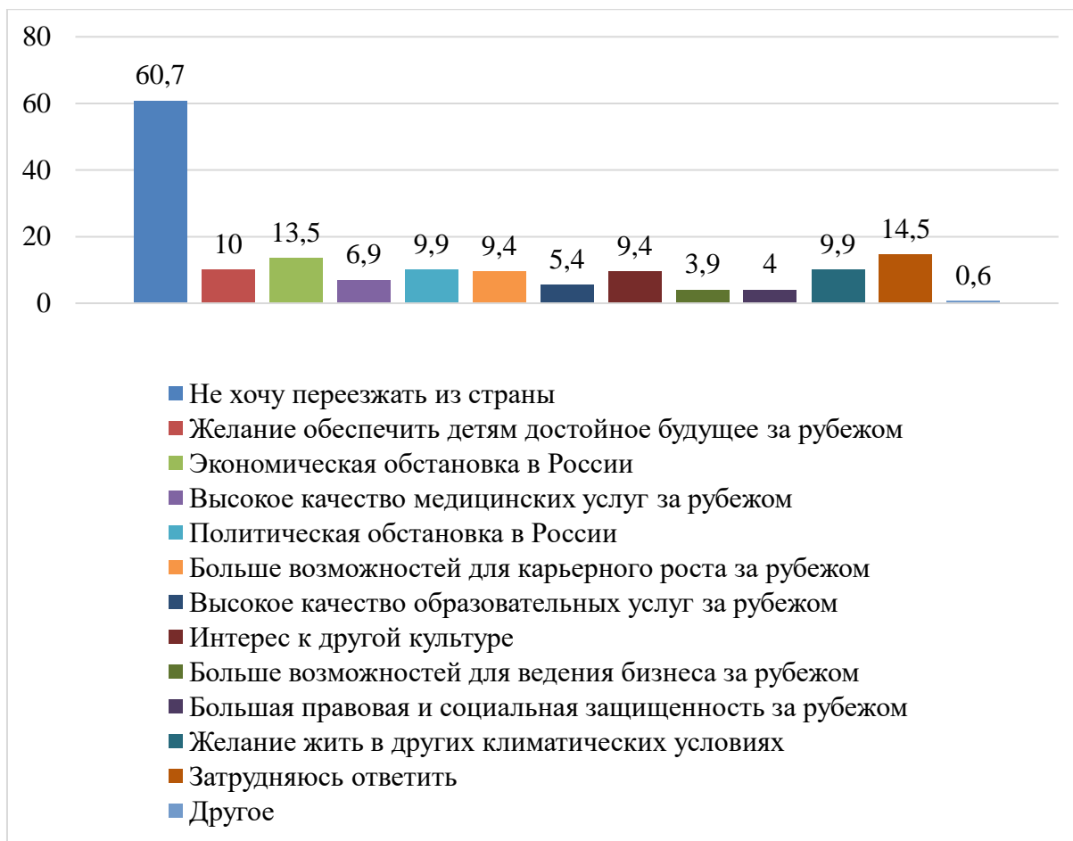
Рисунок 4 – Причины переезда для молодежи в 2024 г., %

Следует отметить, что планы молодых людей на жизнь и работу за границей после окончания обучения не обязательно связаны с желанием покинуть Россию навсегда. Для молодых людей обычной социальной практикой начинает выступать временное проживание за пределами родины: учеба, работа за границей, путешествия. Процессы глобализации делают современный мир открытым, стирая границы между государствами и этносами не только на карте мира, но и в сознании молодых людей. Однако подчеркнем, что несмотря на открытость российской социальной структуры и на все возможности перемещения в социальном и территориальном пространстве, большинство респондентов все-таки планируют свою дальнейшую жизнь в России.