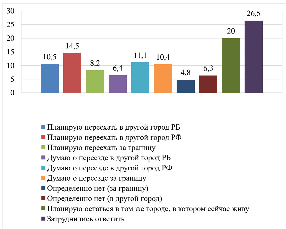
Рисунок 3 – Планы на переезд в 2021 г., %

В вопросе о причинах желания переезда уже 60,7% ответили, что не планируют переезжать из страны. Экономическая обстановка в России является причиной переезда для 13,5% опрошенных. Возможно, они считают, что в других странах экономическая ситуация более благоприятная, и это может повлиять на их решение о переезде. Желание обеспечить детям достойное будущее за рубежом является причиной переезда для 10% опрошенных. Эти люди могут считать, что за границей их дети получают лучшее образование и перспективы для развития. Политическая обстановка в России влияет на решение о переезде для 9,9% респондентов. Вероятно, эти люди недовольны текущей политической ситуацией в стране и ищут более благоприятные условия для жизни. Желание жить в других климатических условиях привлекает 9,9% опрошенных. Они могут искать более комфортные климатические условия для проживания. Больше возможностей для карьерного роста за рубежом привлекает 9,4% опрошенных. Они могут считать, что зарубежные компании предоставляют больше возможностей для профессионального развития и продвижения по службе (рисунок 4).