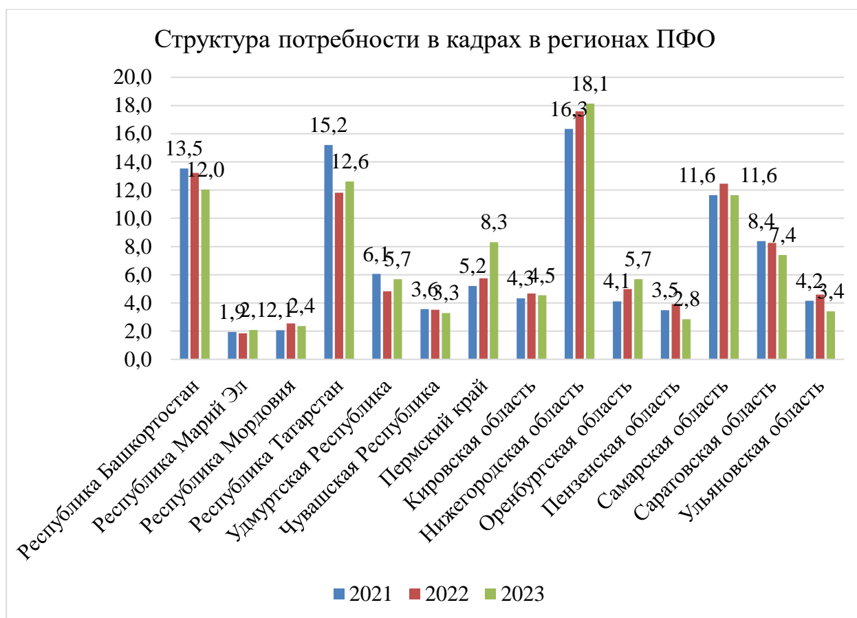
Рисунок 1 – Структура потребности в кадрах в регионах Приволжского федерального округа (в процентах к общему числу по ПФО) [11-13]

В структуре потребности в кадрах наибольший удельный вес в 2023 г. принадлежал Нижегородской области (18,1%), затем Республике Татарстан (12,6%), Республике Башкортостан (12%), Самарской области (11,6%), Пермскому краю (8,3%), Саратовской области (7,4%), Оренбургской области (5,7%), Удмуртской Республике (5,7%), Кировской области (4,5%), Ульяновской области (3,4%), Чувашской республике (3,3%), Пензенской области (2,8%), Республике Мордовия (2,4%), Республике Марий Эл (2,1%).