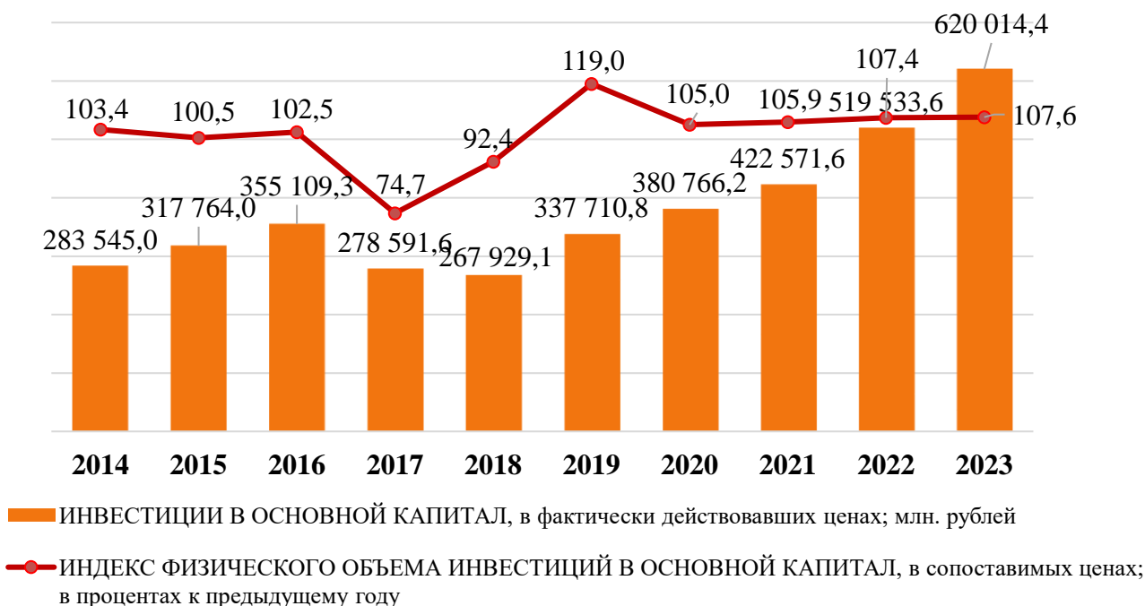
Рисунок 1 – Динамика инвестиций в основной капитал в республике Башкортостан за период с 2014 по 2023 гг. [7]

Перспективы развития реального сектора экономики в региональном разрезе во многом зависят от вливания инвестиций в сфере экономики.