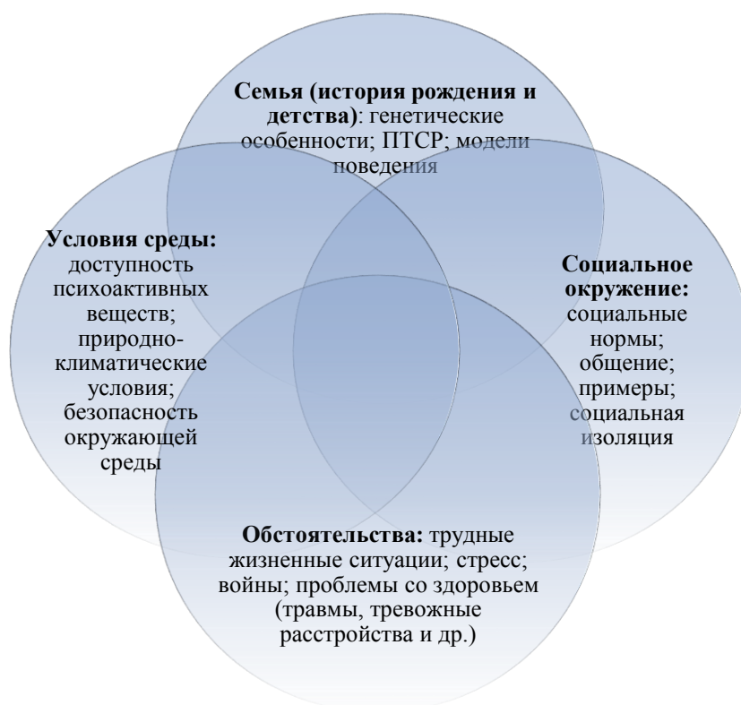
Рисунок 1 – Взаимосвязь факторов появления аддикций

Первая группа «Семья (история рождения и детства)» включает в себя генетические особенности, гены, полученные от родителей, определяющие нарушение дофаминовых рецепторов и транспортера серотонина; ПТСР в случае дисфункциональных семей, где у детей формируется созависимость; модели поведения – копинг-стратегии, когда дети наследуют поведенческие модели от родителей или семьи, где воспитываются, не знают других способов справиться со сложными ситуациями в жизни.