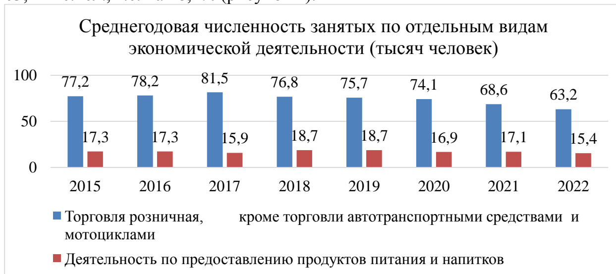
Рисунок 1 – Среднегодовая численность занятых по отдельным видам экономической деятельности (тысяч человек) [3, С.11, 29]

Результаты исследования. Согласно официальным данным Башкортостанстата, численность трудовых ресурсов, занятых в сфере торговли в Республике Башкортостан за период с 2015 по 2022 гг. сократилась с 77,2 до 63,2 тыс.чел., т.е. на 18,1% (рисунок 1).