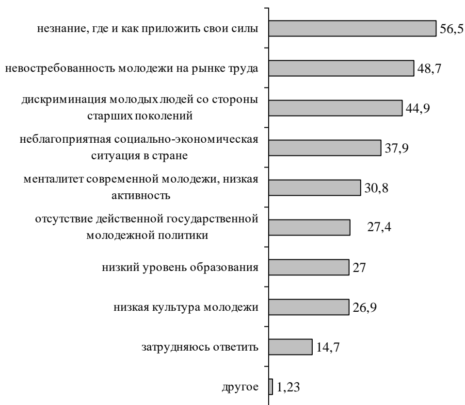
Рисунок 2 Ответы на вопрос «Как Вы считаете, что мешает молодым людям в Республике Башкортостан в полной мере реализовать свои жизненные планы?» (можно выбрать несколько вариантов ответов), % от числа опрошенных

По мнению опрошенных студентов, современная молодежь Республики Башкортостан в большей степени нуждается в помощи при трудоустройстве (68,7%), в помощи в трудных жизненных ситуациях (57,8%), а также в поддержке молодых специалистов на предприятиях и в организациях (52,6%) (рисунок 3).