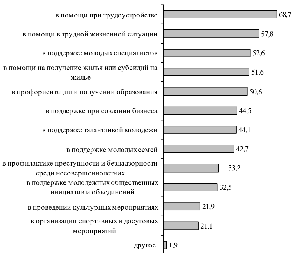
Рисунок 3 Ответы на вопрос «По Вашему мнению, в чем сегодня нуждается современная молодежь?» (можно выбрать несколько вариантов ответов) (в % к числу опрошенных)

Заработная плата – ключевой фактор, который бы мотивировал выпускников остаться в Республике Башкортостан (так ответило 39,3% опрошенных) (рисунок 4).