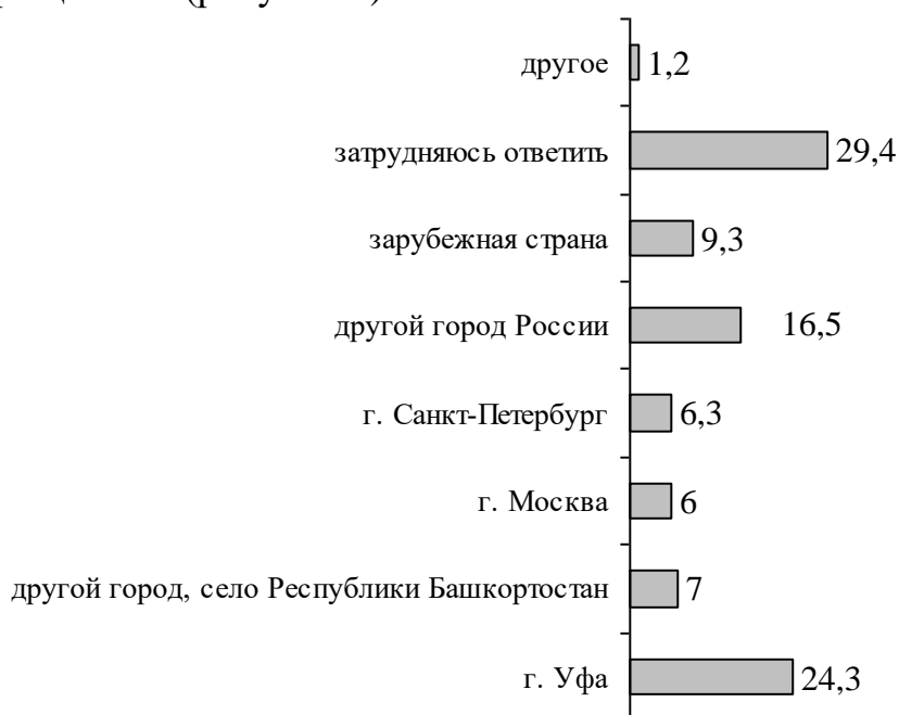
Рисунок 1 Ответы на вопрос «С каким местом Вы связываете свои дальнейшие жизненные планы после окончания вуза?» (один ответ), % от числа опрошенных

ответом (29,4%). С зарубежными странами связывают свою жизнь 9,3% опрошенных (рисунок 1).