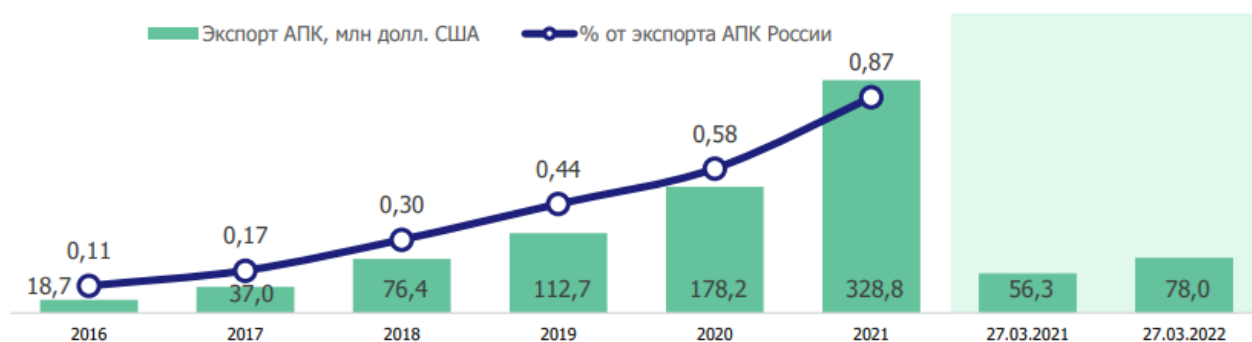
Рисунок 1 Структура экспорта продукции агропромышленного комплекса [1, С. 3]

На отраслевую структуру экспорта продукции агропромышленного комплекса повлияло активное увеличение экспорта масложировой продукции. Эта отрасль экспорта увеличилась с 1,5 млн долл. США в 2016 г. до 231,2 млн долл. США в 2021 г. Доля масложировой продукции в отраслевой структуре экспорта увеличилась на 62,5 п.п. в 2016-2021 гг. (с 7,8% до 70,3%). Объем экспорта других отраслей, за исключением рыбной, в период с 2016 г. наращивался, но с более низкой интенсивностью (рисунок 2).