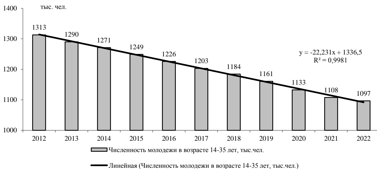
Рисунок 1 – Динамика численности молодежи (14-35 лет) в Республике Башкортостан [5]

При этом, анализируя общую численность молодежи необходимо также учитывать тот факт, что молодежь составляет переходящие возрастные группы и на них оказывают влияние общие проблемы демографических процессов в Республике Башкортостан. Однако за 2012-2021 гг. численность населения Республики Башкортостан сократилась на 62567 чел. (или на 1,57%), в то время как сокращение численности молодежи в возрасте 14-35 лет составило 216339 чел., или на 16,5%. Таким образом, темпы сокращения молодежи в Республике Башкортостан существенно выше, чем сокращение общей численности населения.