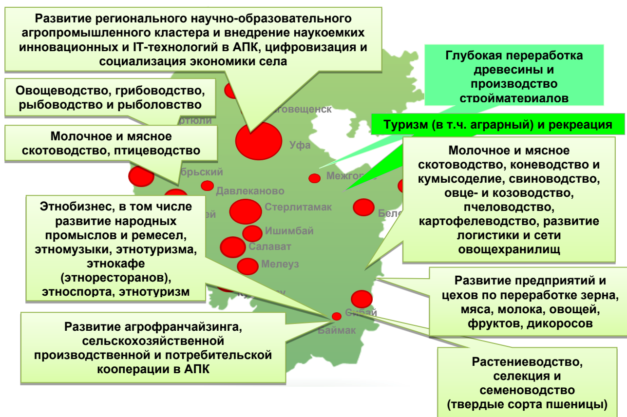
Рисунок 2 – Перспективные «точки роста» экономики сельских территорий Республики Башкортостан

На рисунке 2 представлены наиболее перспективные «точки роста» экономики сельских районов Республики Башкортостан [7].