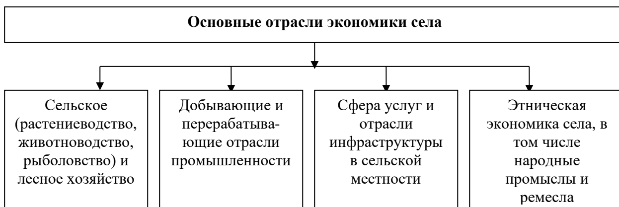
Рисунок 1 Основные отрасли экономики села (разработано автором)

Кроме сельского хозяйства, которое является, безусловно, основой аграрной экономики, среди основных отраслей экономики села можно выделить лесное хозяйство, добывающие и перерабатывающие отрасли промышленности, сферу услуг и отрасли сельской инфраструктуры, этническую экономику, включая народные промыслы и ремесла (рис. 1).