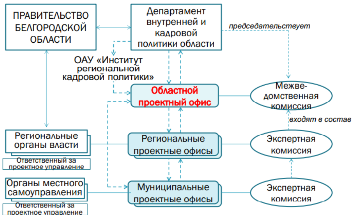
Рисунок 3 – Организационная модель проектного управления Белгородской области

исполнительной власти как на региональном, так и на муниципальном уровнях [4]. Далее, в ходе определенной процедуры в региональных и муниципальных органах власти и отраслевых экспертных комиссиях принимается решение о целесообразности её реализации. Если идея оказывается интересна, то её инициатор приглашается для разработки проекта и в дальнейшем в той или иной форме участвует в её реализации. От органа власти области назначается куратор проекта, осуществляющий организационное сопровождение и мониторинг реализации проекта. Организационная модель проектного управления Белгородской области представлена на рис.3 [5].