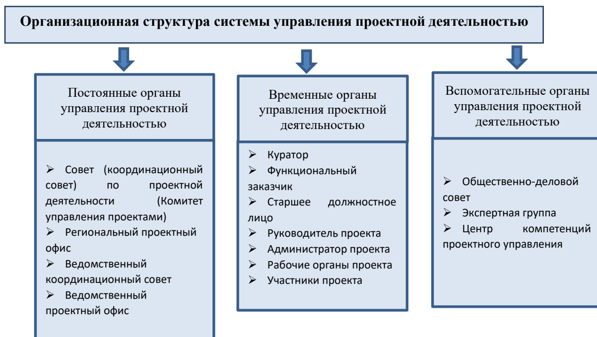
Рисунок 5 – Организационная структура системы управления проектной деятельностью в Республике Башкортостан

По нашему мнению, данная рекомендованная организационная структура повысит эффективность системы управления проектной деятельностью в регионе и позволит решить ряд проблем социально-экономического развития территории.