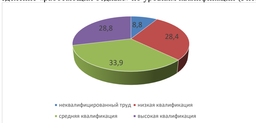
Рис. 2. Распределение респондентов по среднемесячному размеру заработной платы с учетом всех надбавок и выплат

В соответствии с проведенным анализом было получено следующее распределение «работающих бедных» по уровням квалификации (Рис. 2).