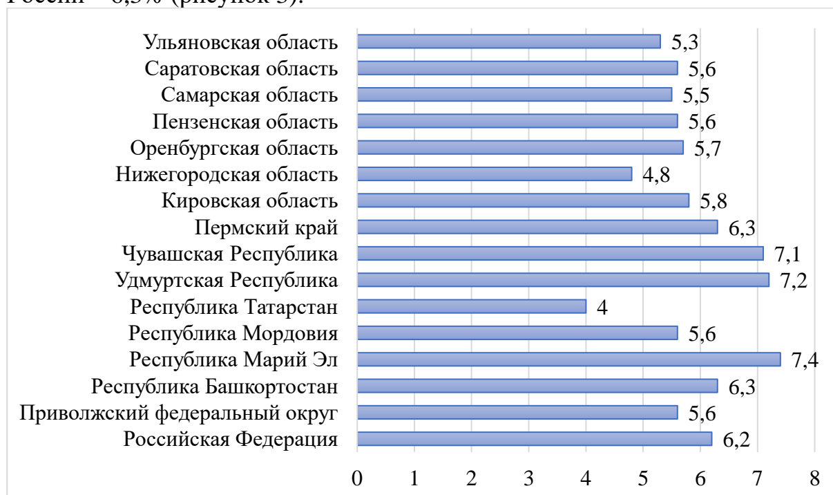
Рисунок 3 Уровень безработицы, в %

В целом по России к концу II квартала 2020 года уровень безработицы составил 6,2%, по Приволжскому федеральному округу 5,6%, в Республике Башкортостан же официальный уровень безработицы превышает среднюю в России – 6,3% (рисунок 3).