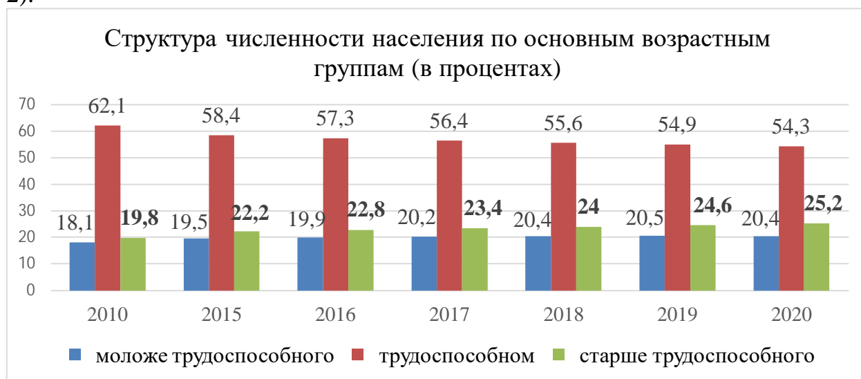
Рис. 2 Структура численности населения по основным возрастным группам (в процентах) [4, 5]

Еще одной яркой тенденцией последнего десятилетия является изменение структуры численности населения по основным возрастным группам (рисунок 2).